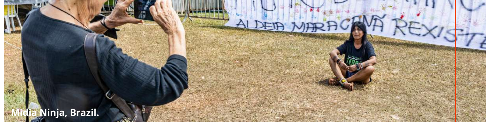
Midia Ninja, Brazil.