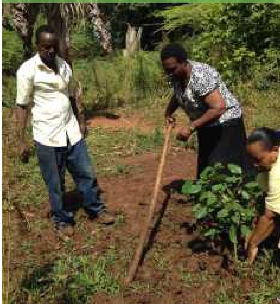
Посадка деревьев в лесном сообществе Каэ, Танзания.

В отчёте Местная Перспектива Биоразнообразия 2016 года, представленном Программой Лесных Народов, Международным Форумом Коренных Народов по биоразнообразию и Секретариатом CBD, содержится отличный обзор