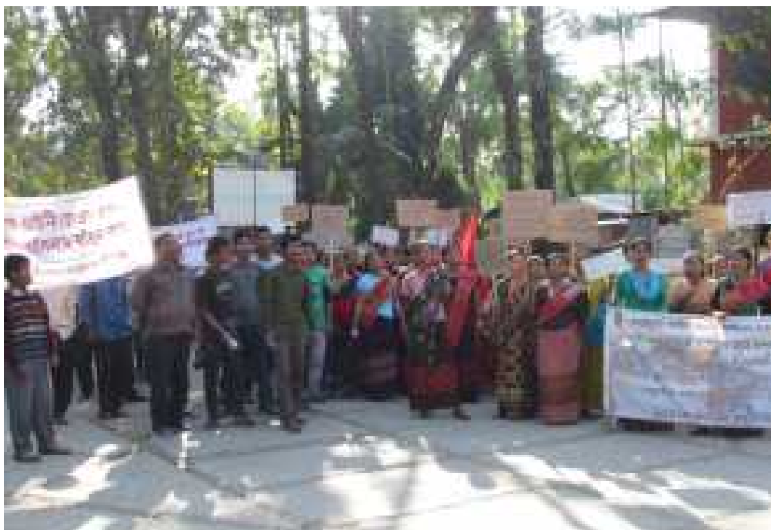
Протест по правам сообществ, призывающий контролировать и управлять лесными ресурсами.

Тем не менее, живущие в лесах группы продвинулись в своей борьбе по реализации самоуправления через Грам Сабха и прав по контролю и управлению лесными ресурсами общин. В Северной Бенгалии, вдоль подножия восточных Гималаев, ряд лесных деревень Тонга самостоятельно собрали свой Грам Сабха и запретили осуществление любых видов деятельности Департамента Лесного хозяйства без их согласия. Эти деревни смогли остановить вырубку лесов, лесозаготовки и высадку плантаций в пределах признанных лесов общин. Деревни в Национальном Парке и Тигровом Заповеднике Тадоба-Андхари (Tadoba-Andhari) обозначили на карте свои лесные ресурсы и подали претензии в отношении CFR. Аналогичным образом многие