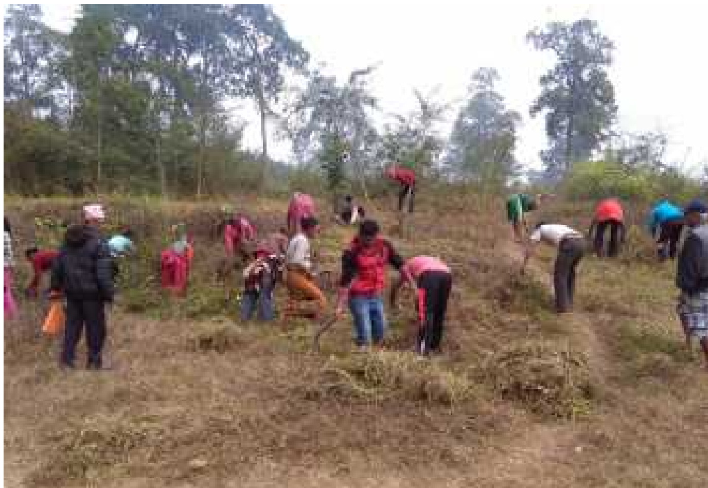
Члены групп местных лесопользователей управляют своей лесной общиной в районе Навалпараси. Nawalparsi FECOFUN

зафиксировал положение о том, что для эффективной реализации NBSAP Коренные Народы и местные общины предстанут в роли важных участников на общинном уровне. Однако, по причине ограниченности ресурсов и слабой поддержки со стороны государственных органов, осуществление непальского NBSAP идет слабым ходом, и большее внимание уделяется централизованным защищаемым зонам, а не сохранности природы общин, традиционным способам устойчивого использования и традиционным знаниям Коренных Народов и местных общин.