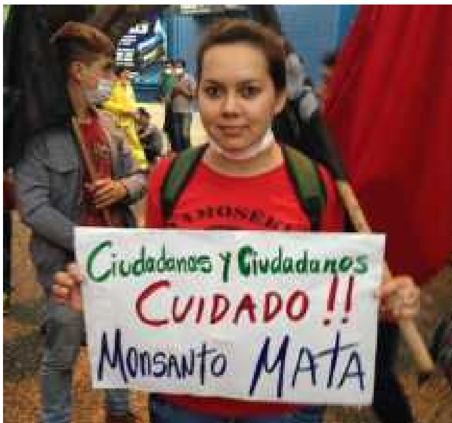
Протест в Парагвае.

считающиеся основными бенефициарами политики в области устойчивого развития. Коренные Народы, местные общины и женщины имеют чётко определенные права в соответствии с международным правом как группы правообладателей; в связи с этим их участие в управленческих структурах является логическим продолжением базирующегося на правах преобразовательного подхода, который лежит в основе Повестки дня ООН 2030 в области устойчивого развития.