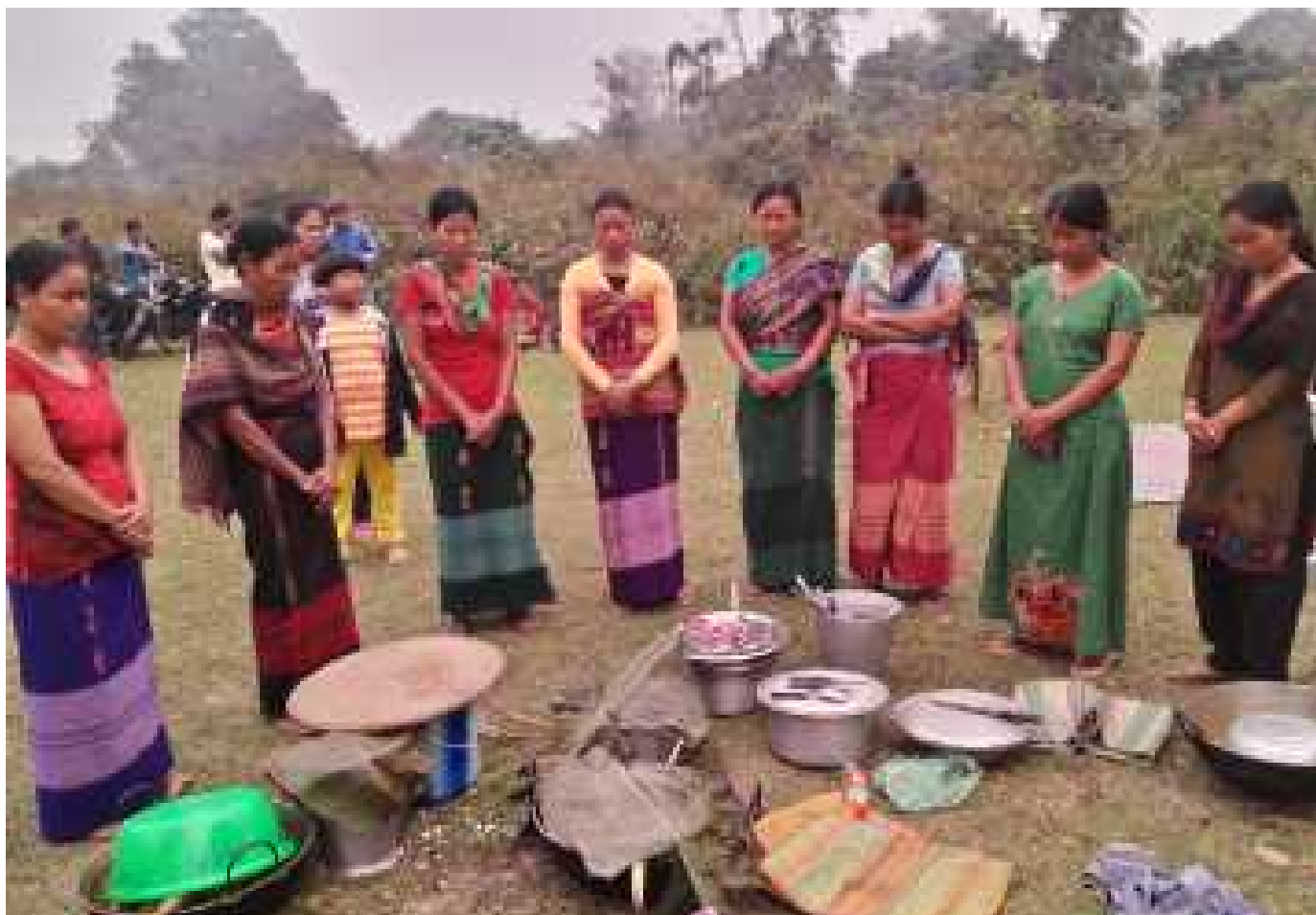
Признание прав общин, обитающих в лесистой местности, включает в себя принятие ответственности за сохранение экологического равновесия.

узурпированных колониальной империей в 19-ом веке, до радикальных движений, возникших в 1990х – увенчалась тем, что Индийский Парламент был вынужден принять Закон о Зарегистрированных Племенах и Других Традиционных Жителях Леса (Признание Прав на Пользование Лесами) в декабре 2016 г. Известное как Закон о Признании Лесохозяйственных Прав (FRA), это исторически важное законодательство восстановило и признало традиционные права лесных общин, которые были похищены в момент консолидации государственных лесов во времена колониального периода, а также в независимой Индии. [1]