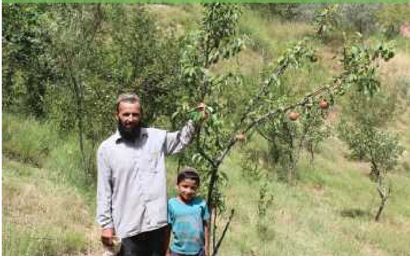
Сбор урожая яблок в Таджикистане. Simone Lovera/GFC

начнётся процесс разработки следующего Стратегического Плана CBD на предстоящих межсессионных совещаниях, такие группы правообладателей как Коренные Народы, местные общины и женщины, должны получить особый статус в этих важнейших переговорах. Они должны иметь возможность в полной мере и эффективным образом принимать участие через свои собственные представительные структуры избирателей, и их вклад в этот процесс следует чётко отличать от вклада заинтересованных сторон, которые попросту имеют коммерческую заинтересованность в биоразнообразии.