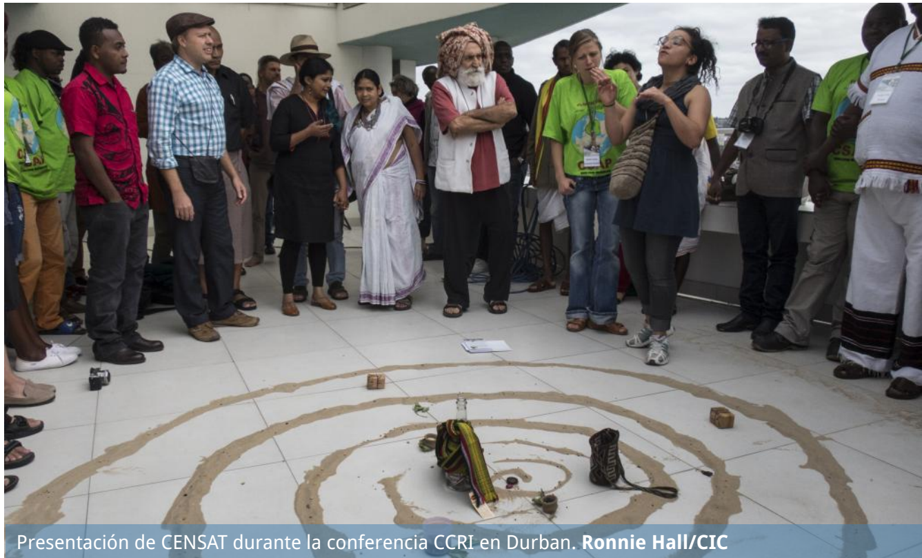
Presentación de CENSAT durante la conferencia CCRI en Durban.

la diversidad biológica. En cada evaluación se hizo un análisis de género utilizando el conjunto de herramientas desarrollado para que la CCRI pueda evaluar las necesidades, los roles y los derechos característicos de las mujeres así como facilitar su participación activa y el fortalecimiento de las iniciativas de conservación comunitaria. Los hallazgos preliminares de los procesos de evaluación de la resiliencia de la conservación comunitaria fueron documentados en diez informes, uno sobre cada país. Además, se iniciaron procesos CCRI en Malasia, India y Colombia, los cuales continuarán durante 2016 y 2017 junto con no menos de diez procesos nacionales más. Varios talleres nacionales de capacitación fueron realizados en las Islas Salomón, Panamá, Rusia, Paraguay, Sudáfrica, Uganda, Irán, Chile y Samoa. Estos talleres capacitaron a los representantes de las comunidades locales en el uso de la metodología CCRI, así como en la forma de defender sus propias recomendaciones con respecto a las formas eficaces de apoyar sus enfoques bioculturales y sus iniciativas de conservación.