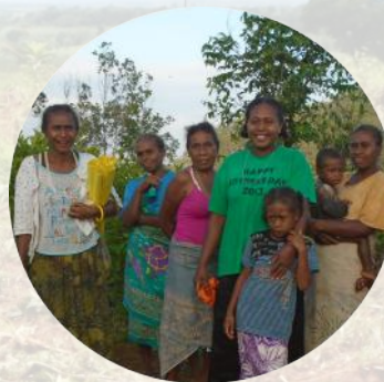
Defensa de los derechos de las mujeres y promoción de la transversalidad de género en la política forestal