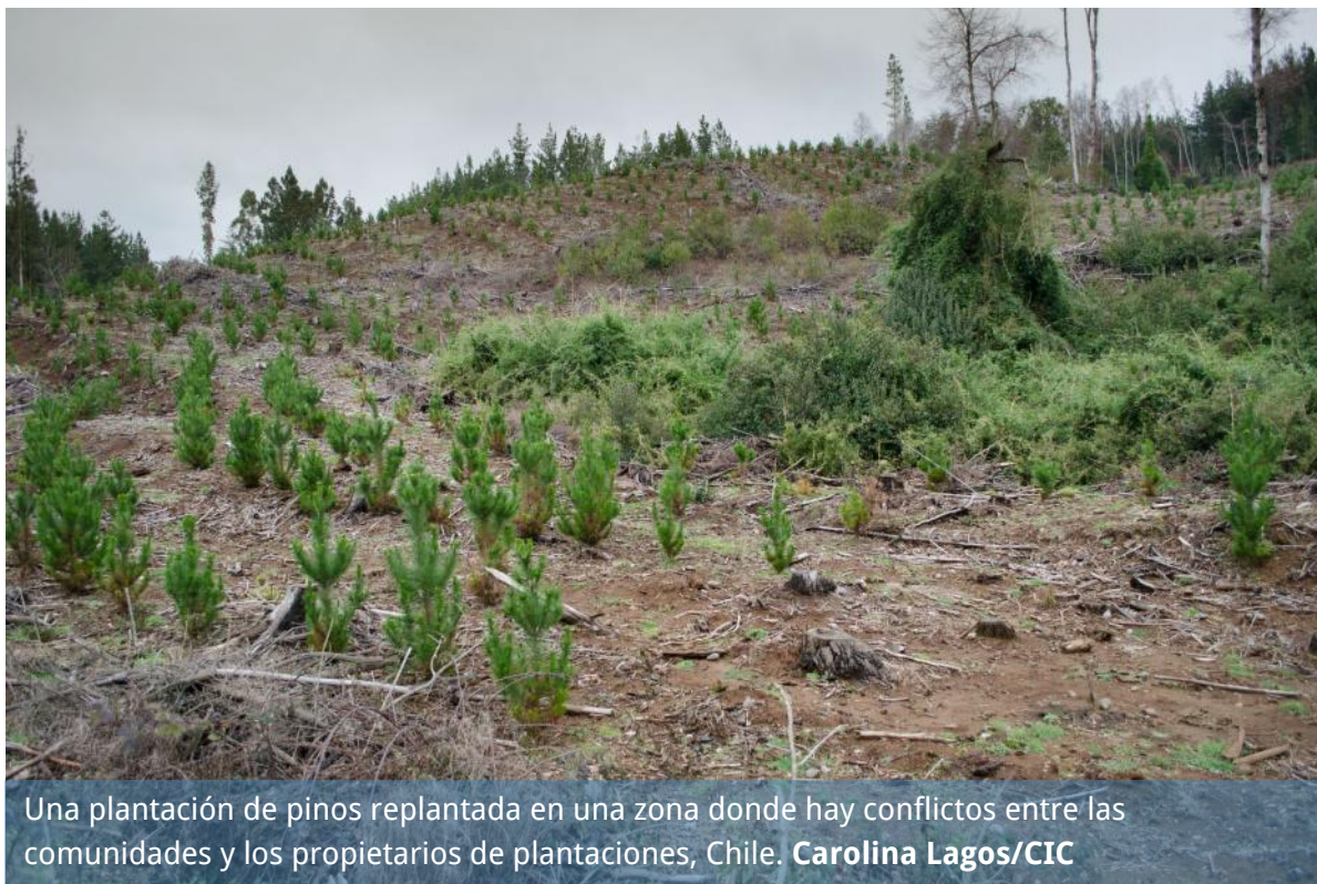
Una plantación de pinos replantada en una zona donde hay conflictos entre las comunidades y los propietarios de plantaciones, Chile.

sobre el impacto de los métodos de contabilización del carbono para el LULUCF (Uso de las tierras, cambio de uso de los suelos y silvicultura) titulado “Tierras, bosques y aire caliente”, con el fin de dar del uso de las tierras una visión completa, holística y