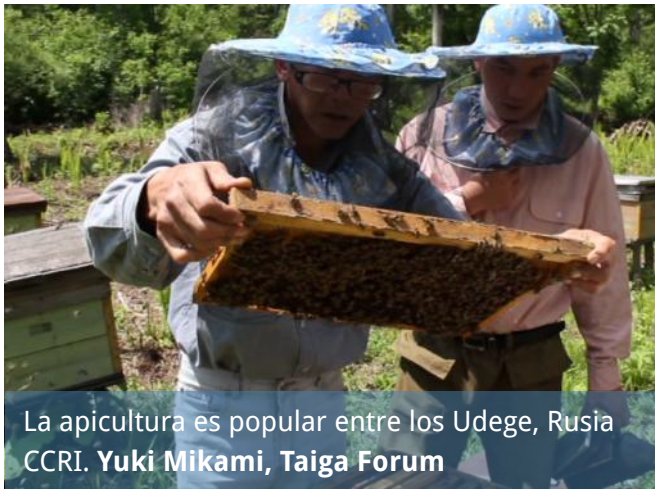
La apicultura es popular entre los Udege, Rusia CCRI. Yuki Mikami, Taiga Forum