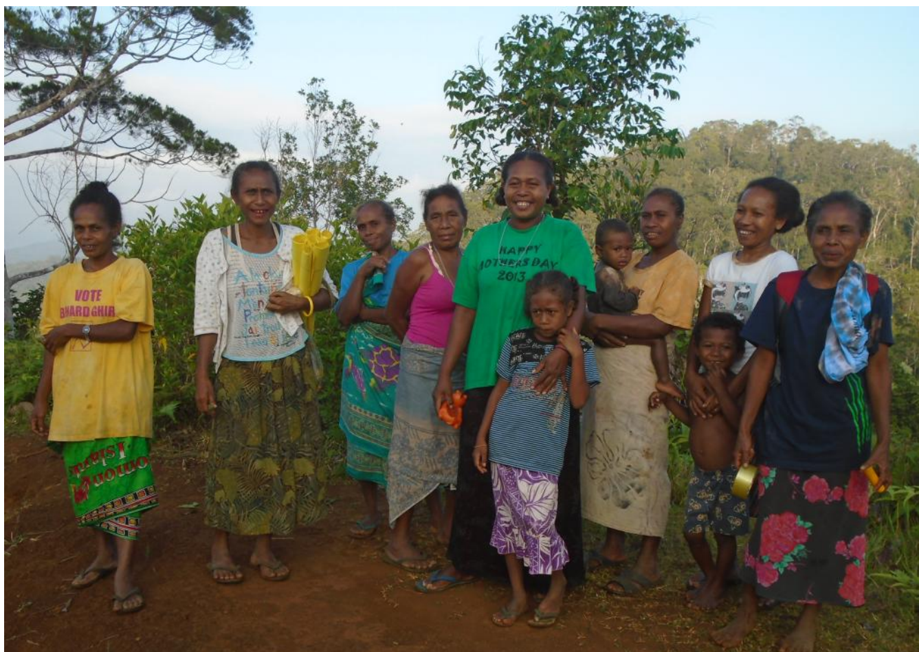
Mujeres preparándose para ir a sus jardines, Hageulu, Islas Salomón.

Adicionalmente, los miembros de la GFC participaron en varias reuniones importantes durante 2015, entre las cuales figuran: la reunión ODS sobre Objetivos y Metas de Desarrollo Sostenible, realizada en marzo; la reunión ODS sobre Medios para implementar y revitalizar la asociación global para un desarrollo sostenible, que incluyó la organización de un evento paralelo sobre medios de implementación no financieros; las reuniones ODS de Seguimiento y Revisión, realizadas en mayo; el Foro Político de Alto Nivel sobre Desarrollo Sostenible que tuvo lugar del 26 de junio al 8 de julio; las Reuniones ODS de