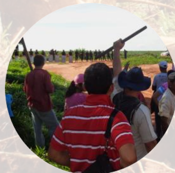
La ganadería no sostenible