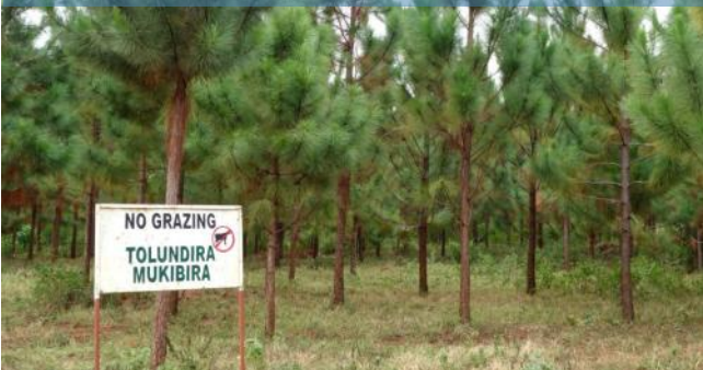
Comunidades expulsadas de sus tierras de pastoreo. Carbon Violence