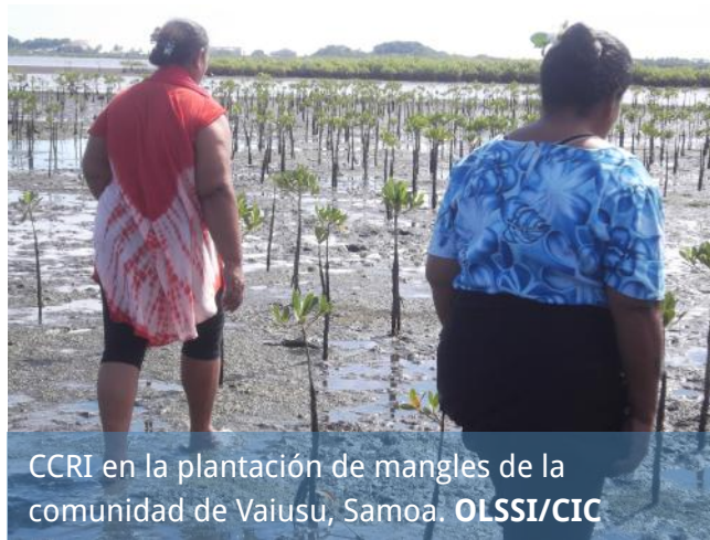
CCRI en la plantación de mangles de la comunidad de Vaiusu, Samoa. OLSSI/CIC