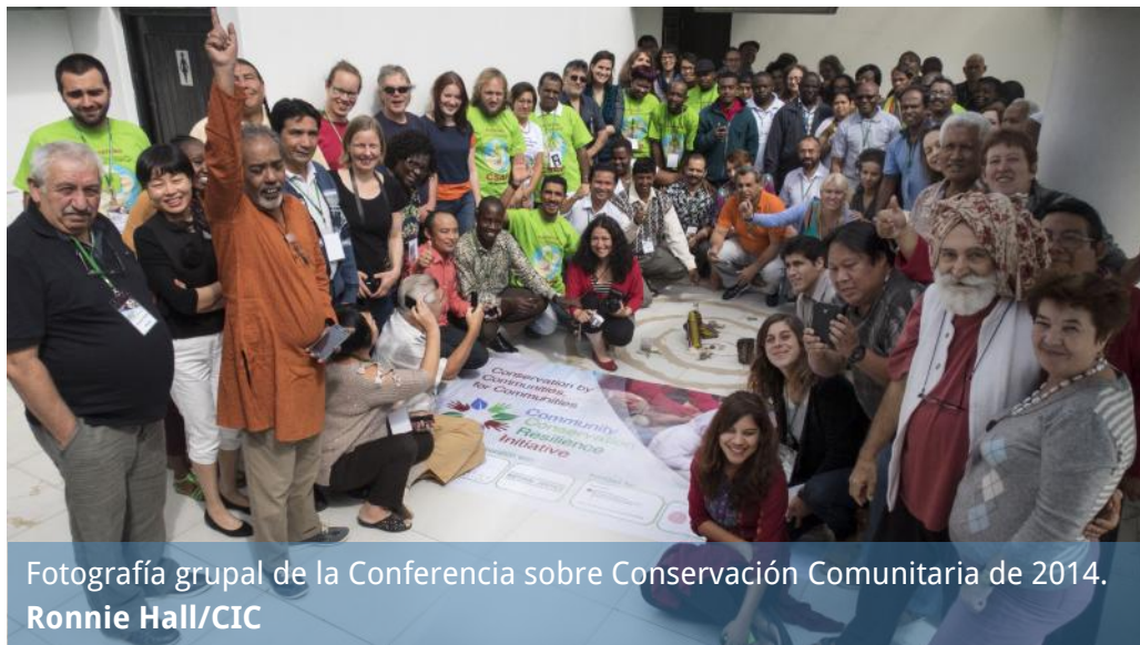
Fotografía grupal de la Conferencia sobre Conservación Comunitaria de 2014.

reclamaciones que serán incorporadas en la siguiente fase de la CCRI, proponiendo soluciones y buscando un apoyo político, económico y jurídico apropiado para las iniciativas de