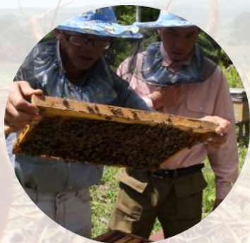
Iniciativa de Resiliencia de la Conservación Comunitaria