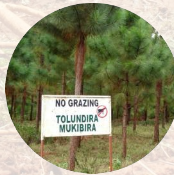
Producción a gran escala de bioenergía a base de madera, y otras formas de acaparamiento verde